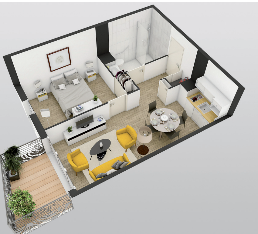
Exemple de T2 - Illustration non contractuelle