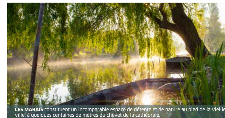
LES MARAIS constituent un incomparable espace de détente et de nature au pied de la vieille ville, à quelques centaines de mètres du chevet de la cathédrale.