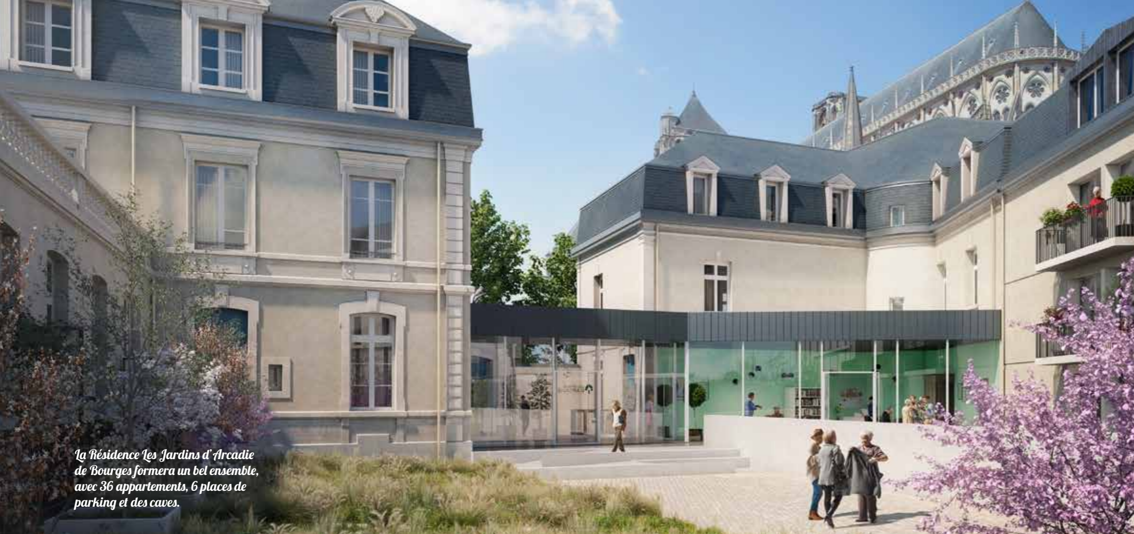
La Résidence Les Jardins d'Arcadie de Bourges formera un bel ensemble, avec 36 appartements, 6 places de parking et des caves.