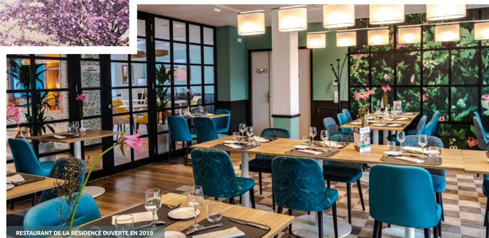
RESTAURANT DE LA RÉSIDENCE OUVERTE EN 2019

Ainsi la résidence services seniors de Bourges répond aux besoins d'une population senior qui, bien qu'étant autonome, profite chaque jour d'un cadre de vie adapté.