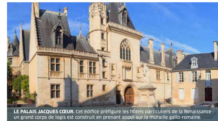
LE PALAIS JACQUES CŒUR. Cet édifice préfigure les hôtels particuliers de la Renaissance : un grand corps de logis est construit en prenant appui sur la muraille gallo-romaine.

Bourges est alors l'étape incontournable de La Route Jacques Cœur, la plus ancienne route touristique de France.