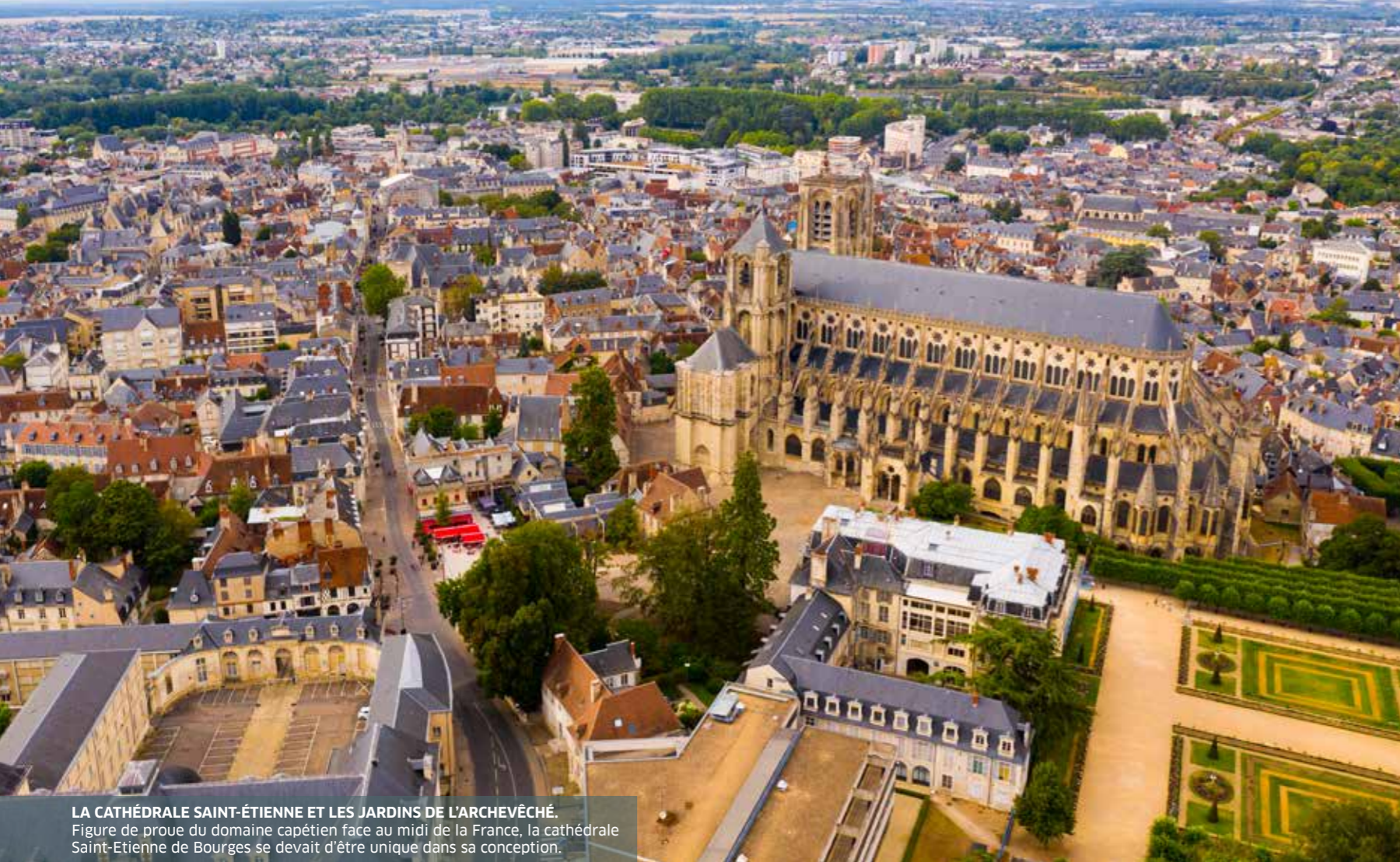
LA CATHÉDRALE SAINT-ÉTIENNE ET LES JARDINS DE L'ARCHEVÊCHÉ. Figure de proue du domaine capétien face au midi de la France, la cathédrale Saint-Etienne de Bourges se devait d'être unique dans sa conception.