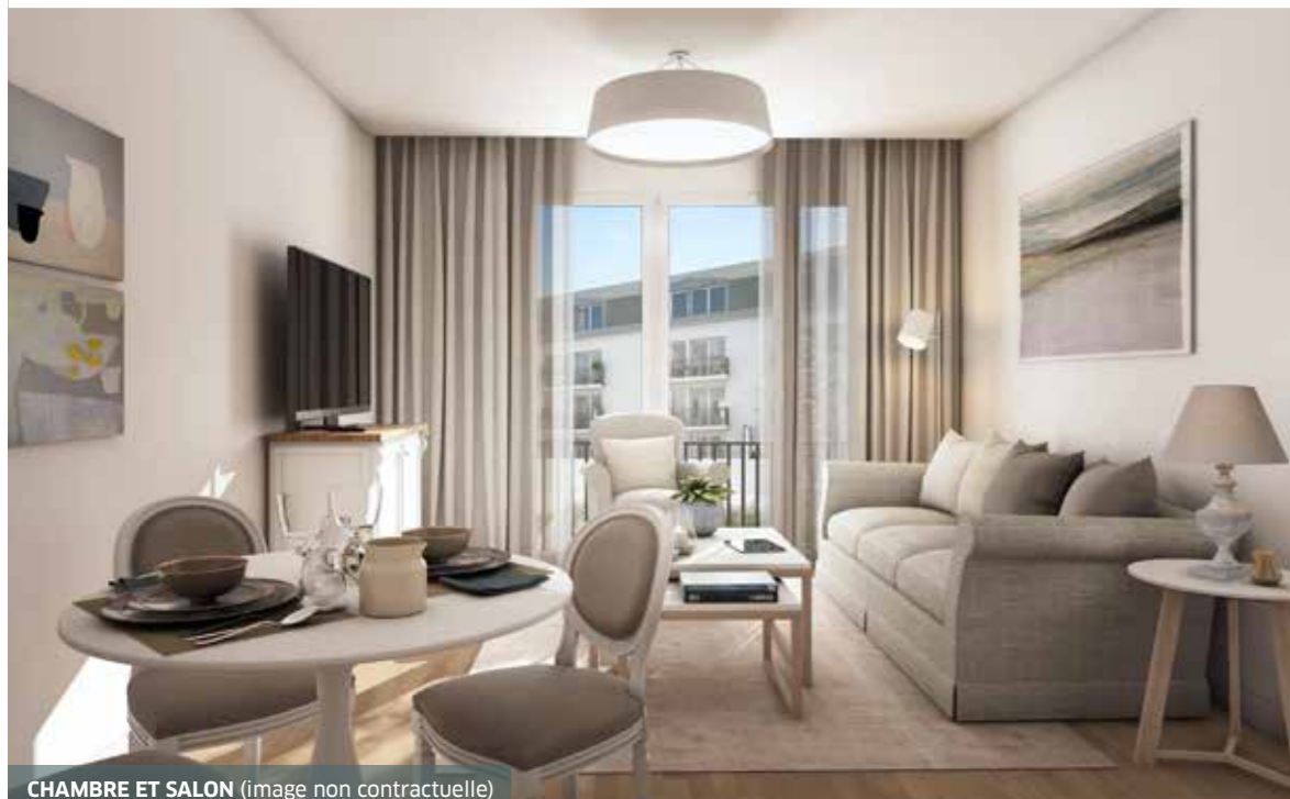
CHAMBRE ET SALON (image non contractuelle)