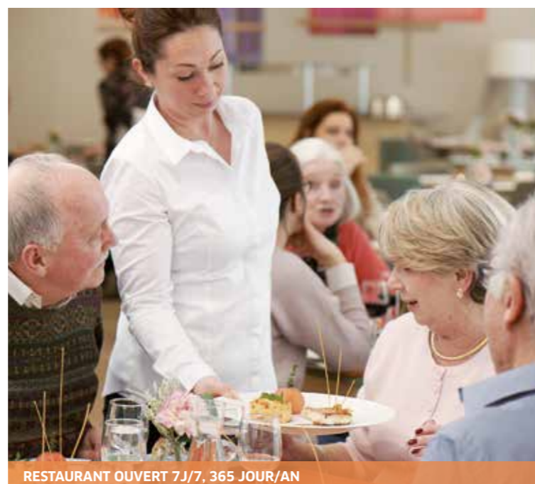
RESTAURANT OUVERT 7J/7, 365 JOUR/AN