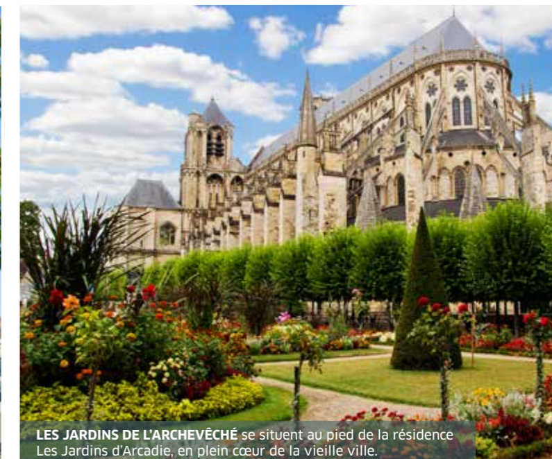
LES JARDINS DE L'ARCHEVÊCHÉ se situent au pied de la résidence Les Jardins d'Arcadie, en plein cœur de la vieille ville.