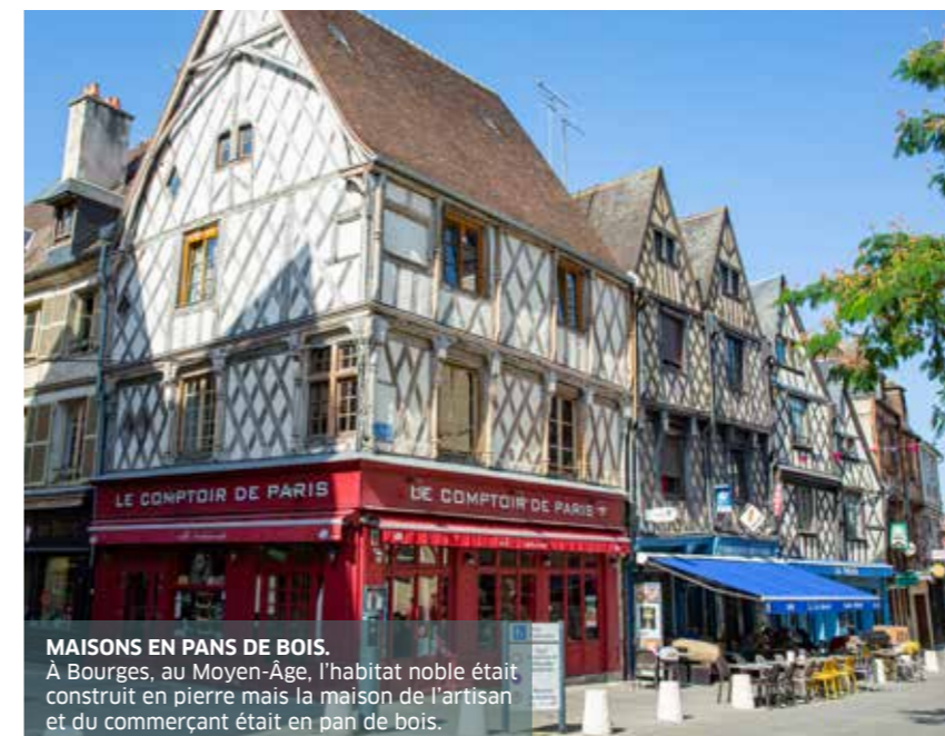
MAISONS EN PANS DE BOIS. À Bourges, au Moyen-Âge, l'habitat noble était construit en pierre mais la maison de l'artisan et du commerçant était en pan de bois.

Ville aérée, Bourges offre aussi en son cœur de beaux jardins comme ceux de l'Archevêché, reprenant les codes du jardin à la française et celui des Prés-Fichaux, labellisé « Jardin Remarquable » et bien sûr Les Marais.